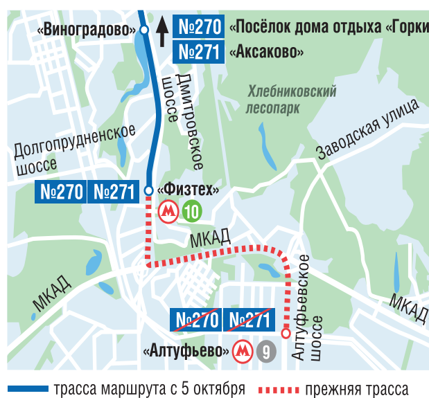
— трасса маршрута с 5 октября ..... прежняя трасса