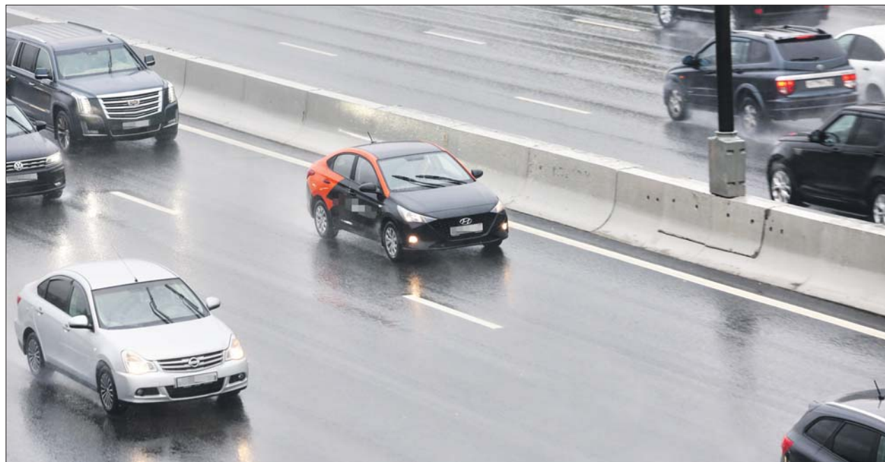
83-й километр МКАД. На таких крупных магистралях контроль скорости особенно важен

Для машин каршеринга разрабатывают систему принудительного снижения скорости