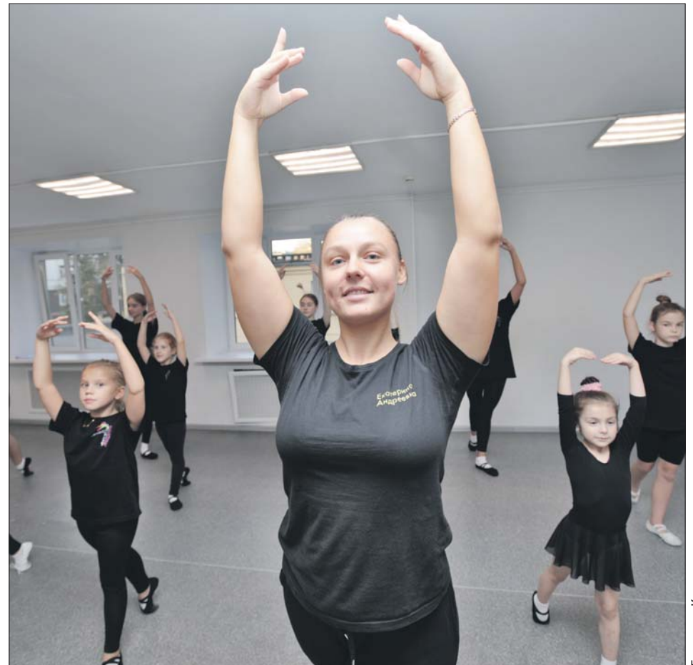
Классическая хореография улучшает осанку и укрепляет мышцы