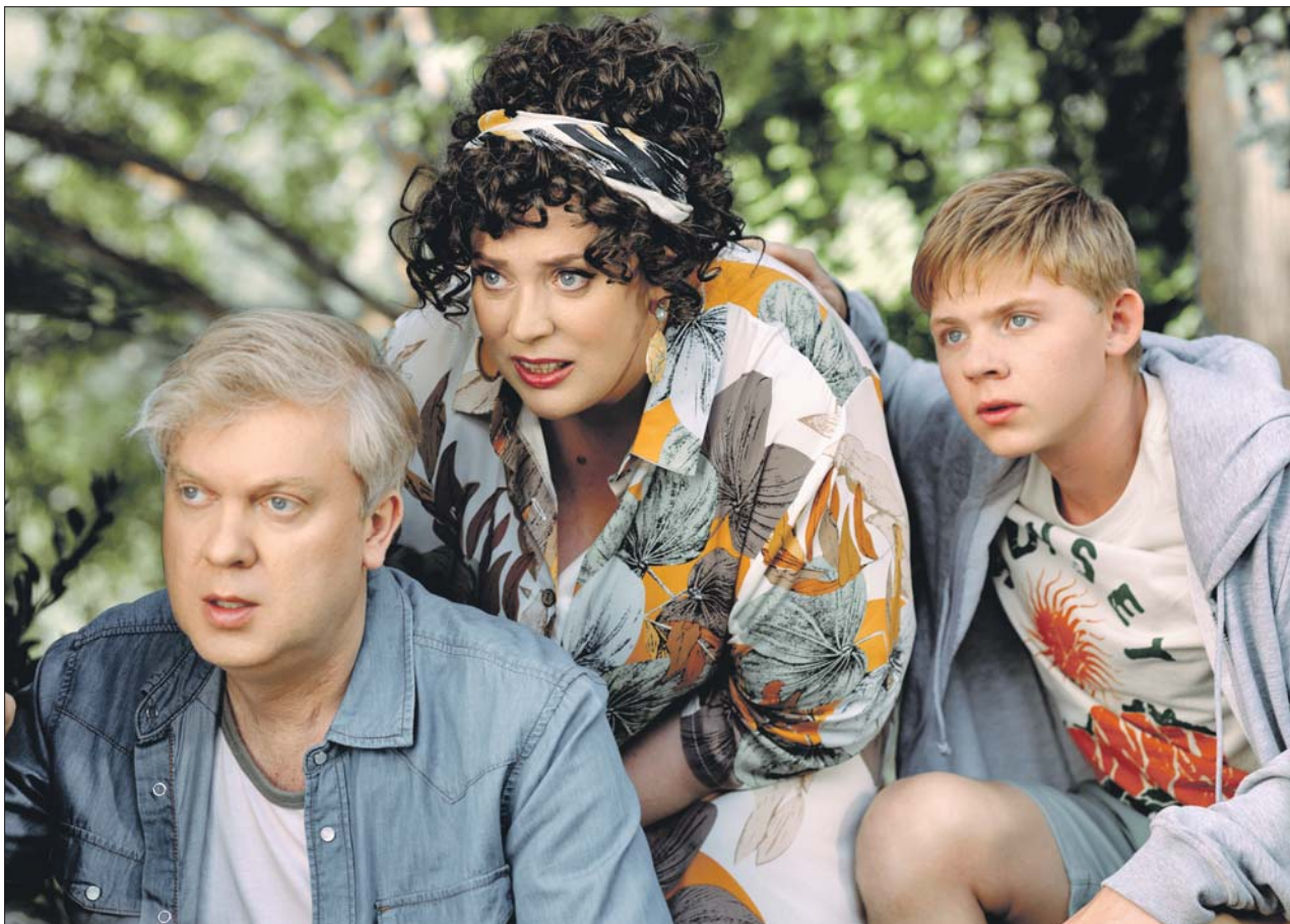
Комедия «Беляковы в отпуске» поведает зрителям о приключениях семьи на морском побережье