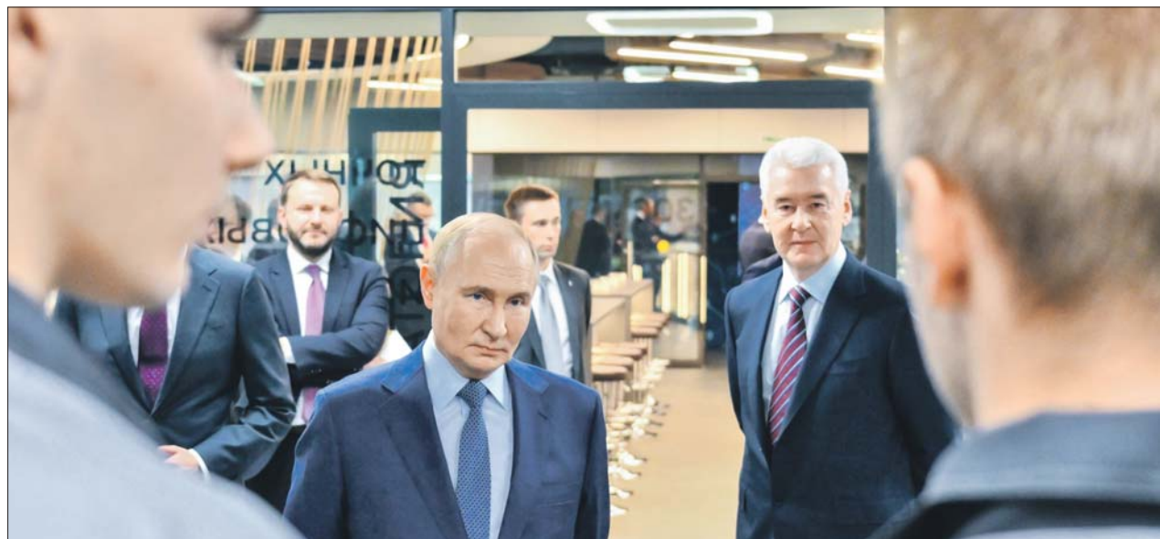
Владимир Путин и Сергей Собянин пообщались со студентами колледжей

Владимир Путин и Сергей Собянин открыли в Москве полигон подготовки будущих профессионалов