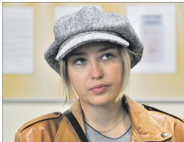
В пункте на улице Яблочкова побывала актриса Аглая Шилова