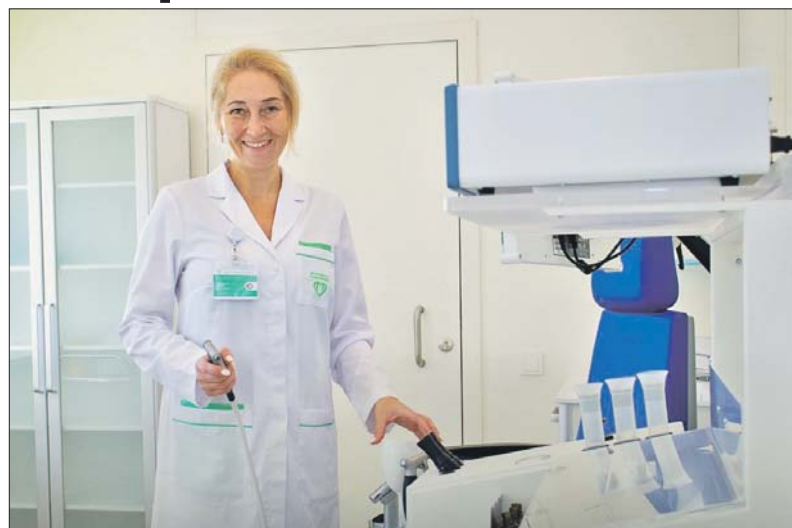
Поликлинику на Староалексеевской улице оснастили новым оборудованием

— Создали более комфортную среду для маломобильных граждан.