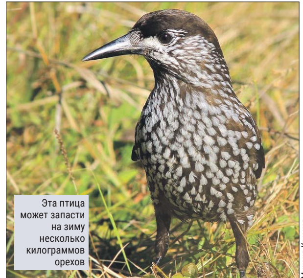
Эта птица может запасти на зиму несколько килограммов орехов

Иногда кедровка может превращаться в разбойника, как и другие врановые (её