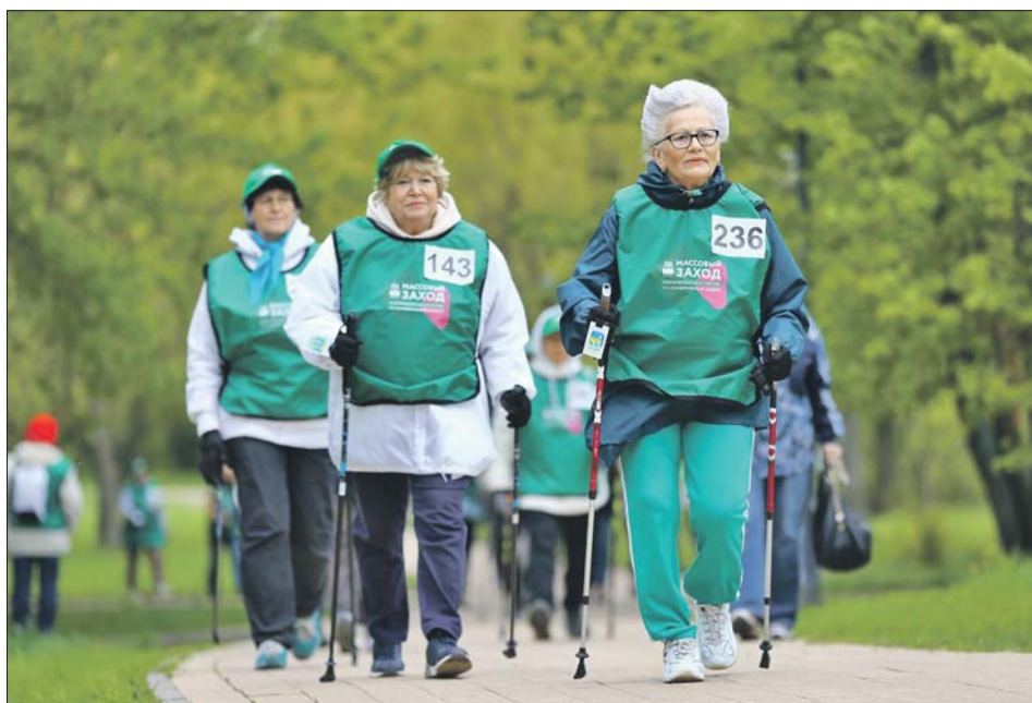
В 2025 году столица продолжит развивать проект «Московское долголетие»

«Будем внедрять более гибкие и эффективные инструменты, улучшать качество обслуживания за счёт цифровой трансформации и упрощать