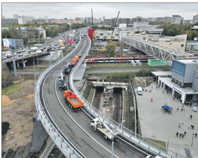
Эстакада обеспечивает прямой съезд с основного хода МСД на Волгоградский проспект в сторону МКАД

Теперь водителям не нужно совершать объезд через Шоссейную улицу. Перепробег автотранспорта, таким образом, сократится в два раза. За счёт перераспределения транс-