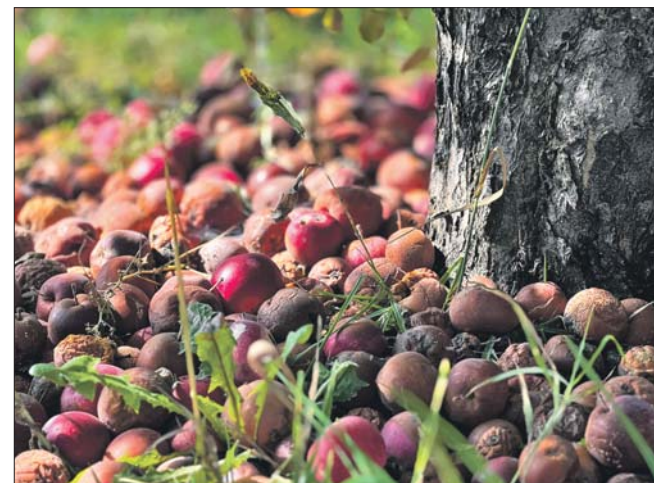
В плодах, не убранных с земли, могут зазимовать вредители