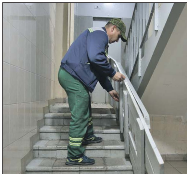
Гвозди держали пандус в таком положении

Помимо пандусов, на лестницах от входа в подъезд до лифтового холла могут смонтировать подъёмную электроплатформу. Такие заявки принимают уже только от инвалидов-колясочников. После этого специальная комиссия проводит обследование, выясняя, позволяют ли технические параметры подъезда установить устройство. И если да, то монтаж запланируют на следующий год.