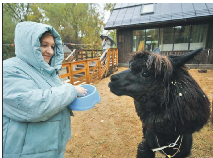
Помимо новых обитателей, гостей ждут и старожилы «Городской фермы»