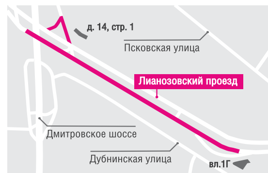
— ограничение движения Ограничения на маленьком участке будут действовать до конца октября, на большом — до 19 декабря