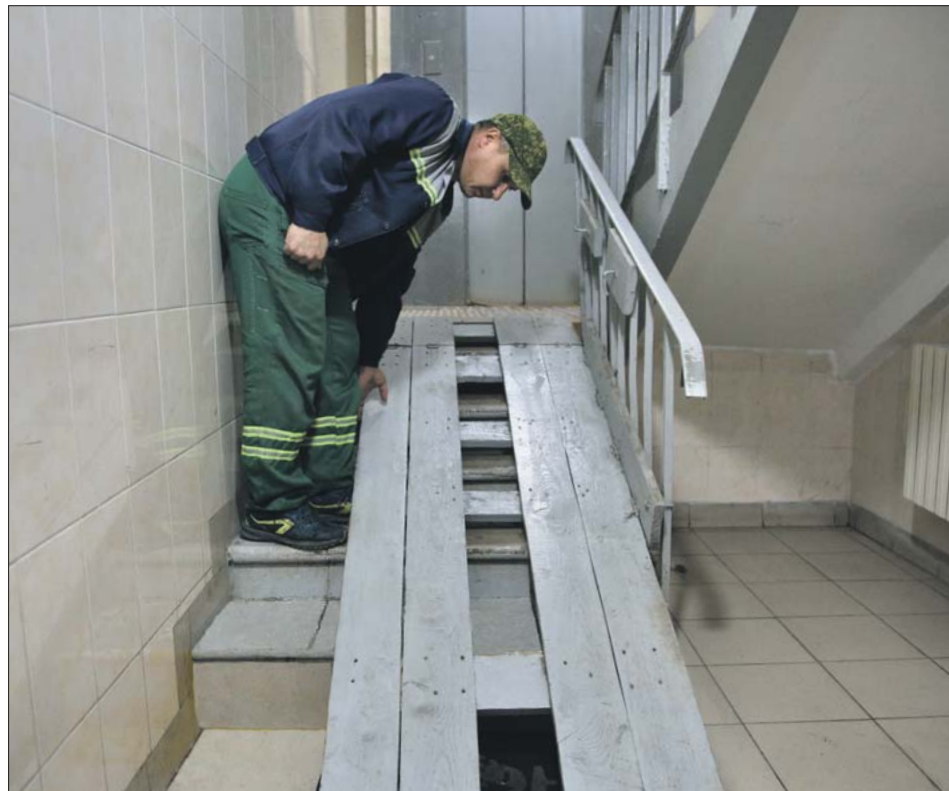
Сотрудник «Жилищника» устранил проблему в тот же день, когда о ней стало известно коммунальщикам