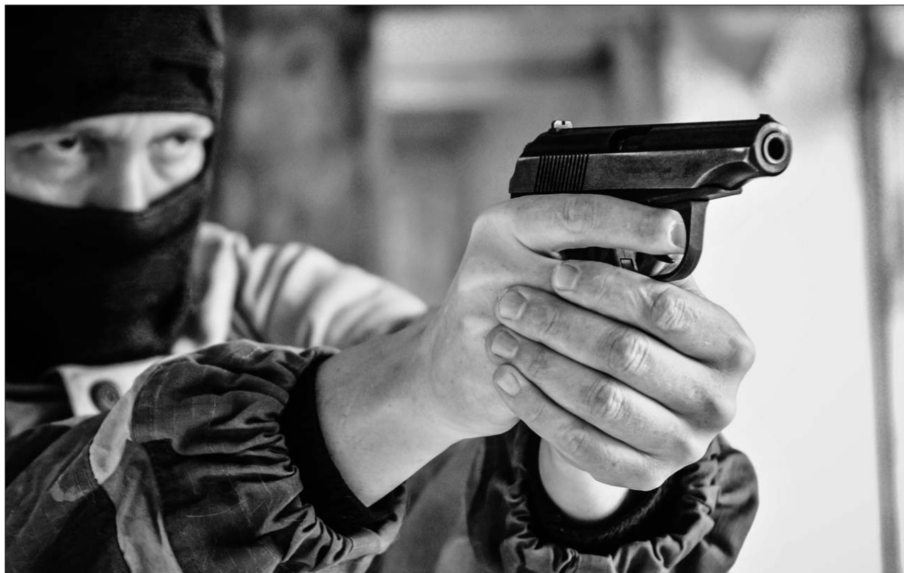
Главарь криминальной банды стал жертвой своих подельников

Во время разговора атмосфера накалилась, и молодой подельник стал угрожать старшему. Тот уверял, что все получают поровну. Оппонент ему не поверил и начал остервенело жать на курки сразу двух писто-