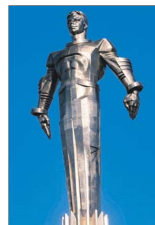
Реставрация памятника завершена

Отреставрировали и макет спускаемого аппарата космического корабля «Восток». Он вновь занял своё место у подножия памятника.