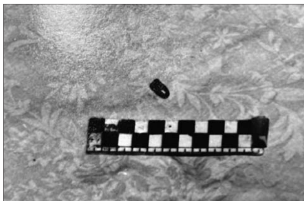
Из материалов дела: фото одной из гильз на месте преступления

летов — на месте преступления насчитали девять гильз. У потерпевшего не было шансов выжить.