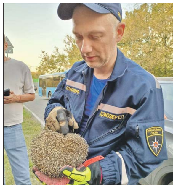
Колючего зверьку достали из глубокой трубы