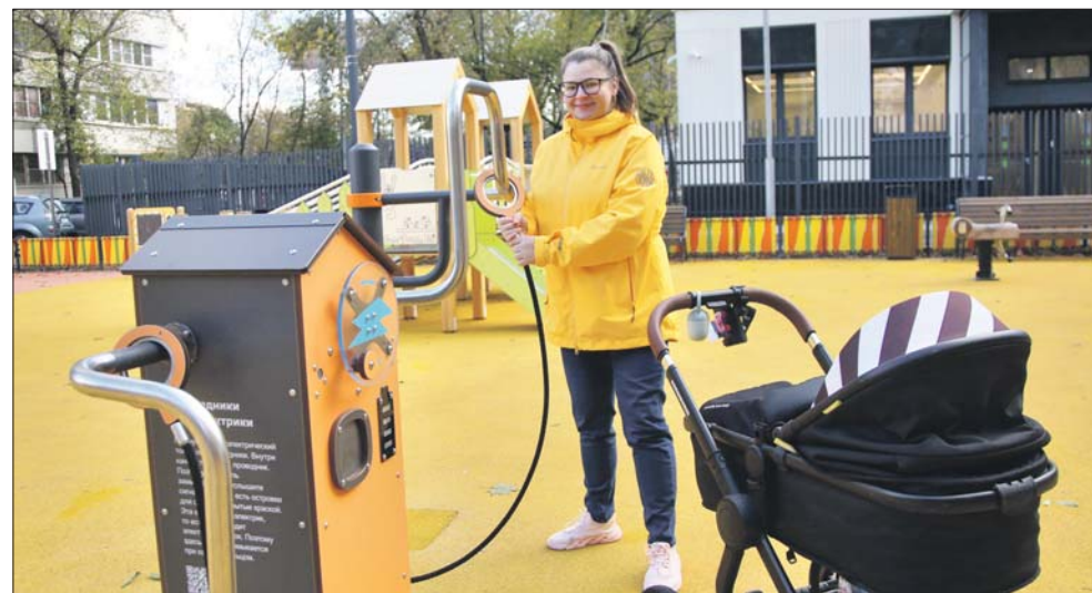
Элементы детской площадки на Шереметьевской познакомят малышей с основами естественных наук