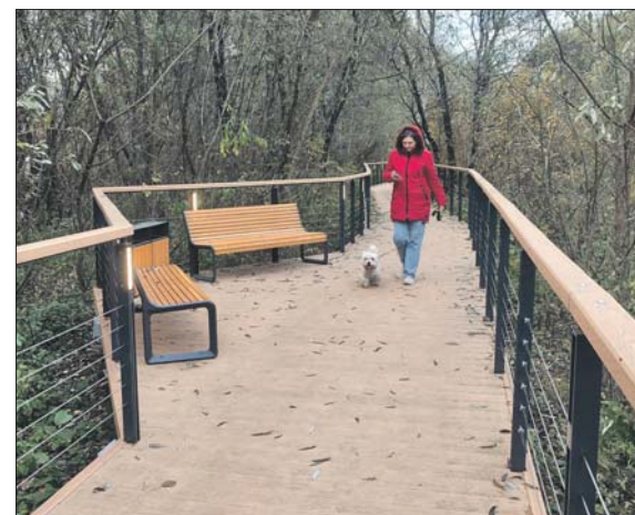
Маршрут протянулся больше чем на 2 километра