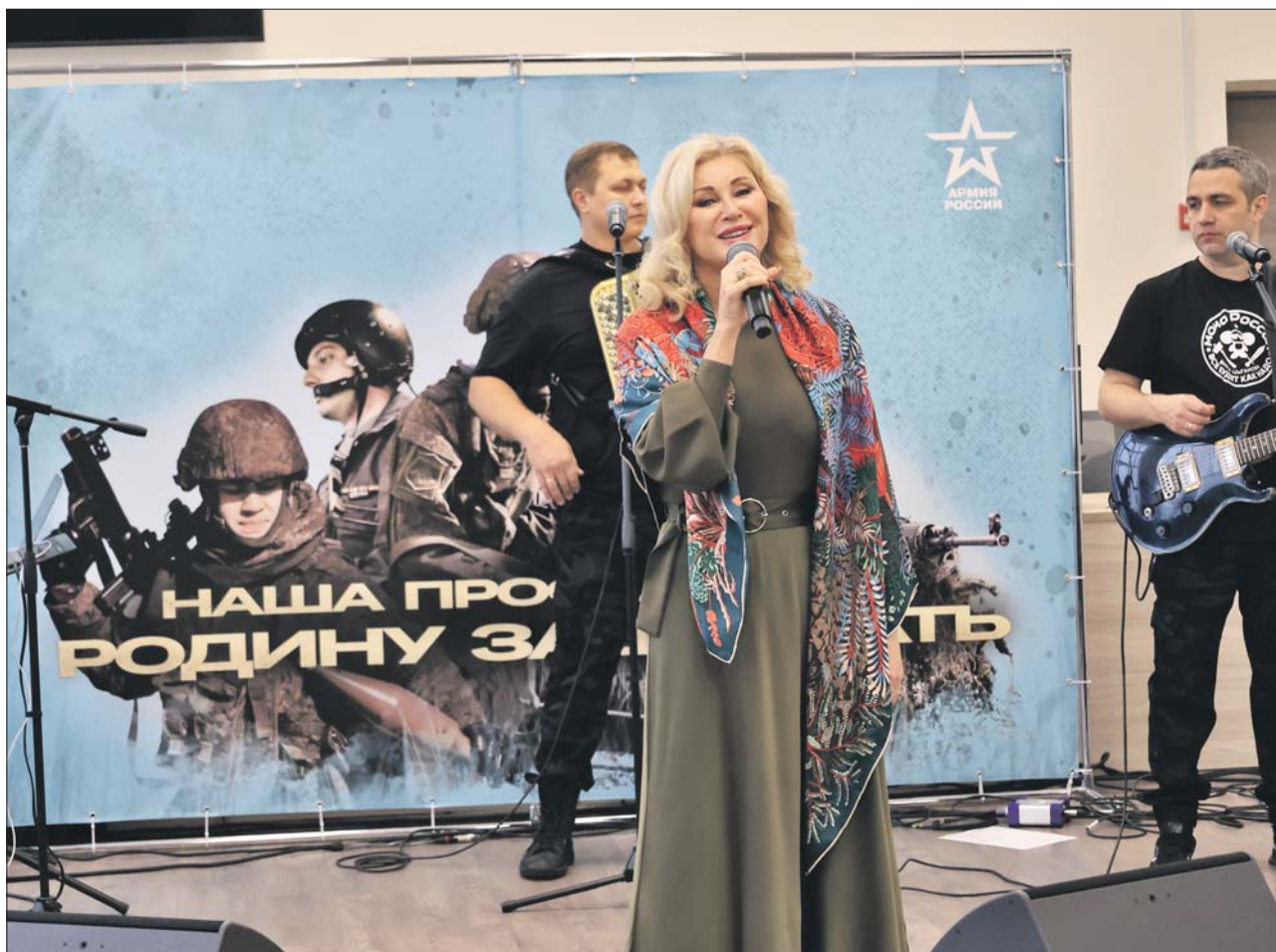
Вика Цыганова уверена, что хорошая песня помогает поднять боевой дух