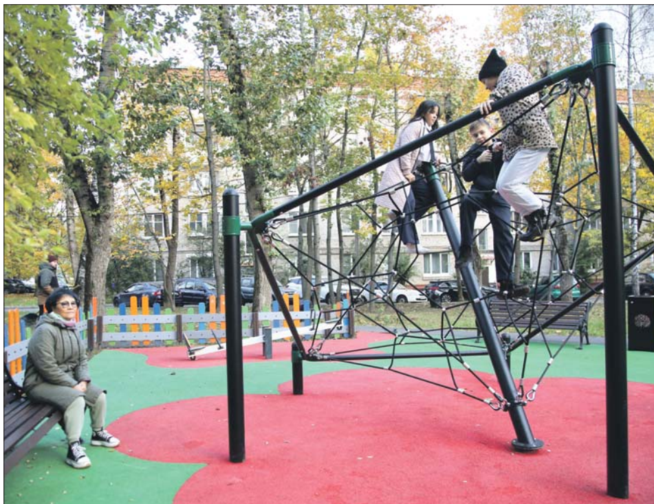
У дома 18 на улице Академика Комарова сделали современную зону для подвижных игр

В Марфине обновили пять придомовых пространств, в том числе детские площадки