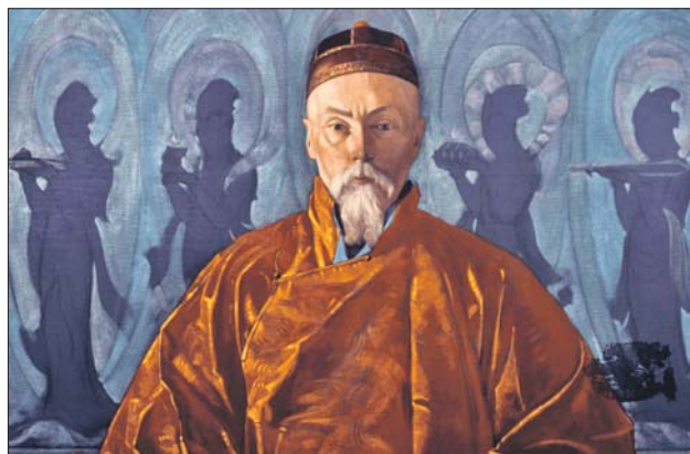
Этот портрет отца создал Святослав Рерих

— Несмотря на всё разнообразие обликов, Майтрею всегда можно отличить по атрибутам. У него обязательно есть сосуд с чистой