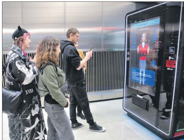
Цифровая стойка «Живое общение» вызывает интерес у пассажиров

Передняя панель — это ростовой экран, с которого на пассажира смотрит 3D-воплощение чат-бота Александры. Рядом — темы и вопросы, на которые она может ответить. Я спросила у чат-бота, куда можно