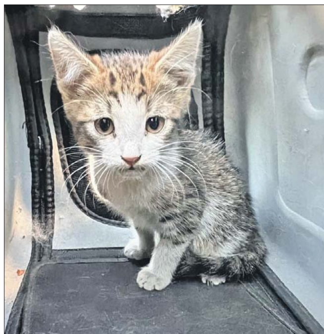
Малыш уже обрёл любящих хозяев