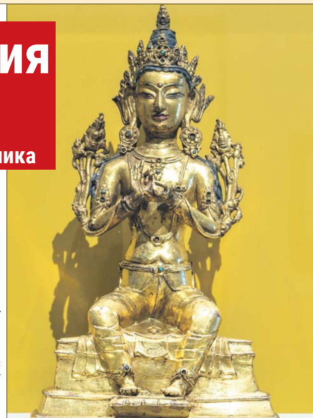
Тибетская скульптура из личного собрания семьи Рерих

Ещё один оригинальный экспонат — танка (свиток-картина), где изображён небожитель Гэсэр, который перерождается на земле в человека и очищает землю от чудовищ,