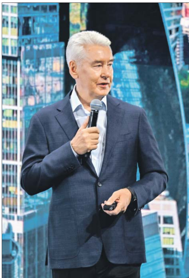
Мэр выступил на форуме в Сочи

По мнению мэра Москвы, главная задача мегаполисов — обеспечить возможности для комфортного передвижения по городу.