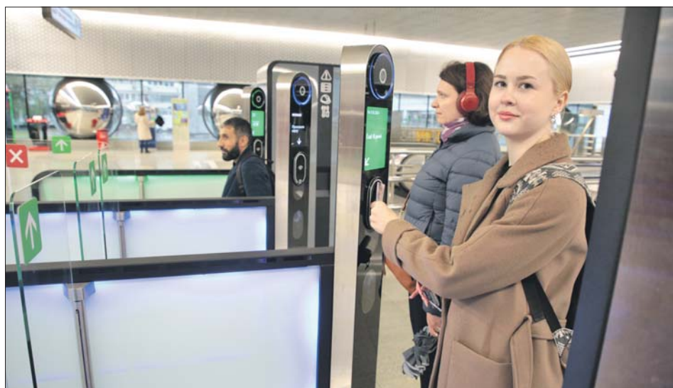
Считыватель карт на новых турникетах расположен на уровне вытянутой руки

Другая новинка появилась пару недель назад — это стойка «Живое общение». Но не классическая, когда за инфостойкой с сувенирной продукцией находится сотрудник, а цифровая.