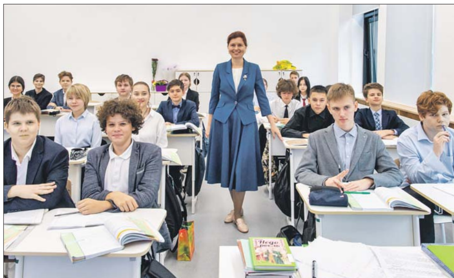
Одна из современных школ не так давно открылась на улице Цандера

В соответствии с АИП в ближайшие три года планируют ввести 259 км дорог и 45 искусственных сооружений. Среди знаковых объектов мэр упомянул, в частности, завершение соединения южного направления МСД и автомобильной дороги Солнцево — Бутово — Варшавское шоссе.