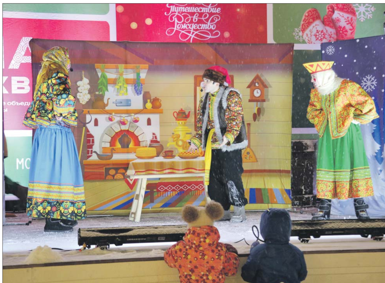
На фестивальной площадке в Северном Медведкове артисты выступают в образах героев народных сказок

В округе показывают зимние шоу и проводят игры для детей