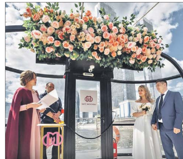
В Москве зарегистрировать брак можно даже на теплоходе

Для удобного подбора площадок на портале mos.ru появился сервис «Наша свадьба».