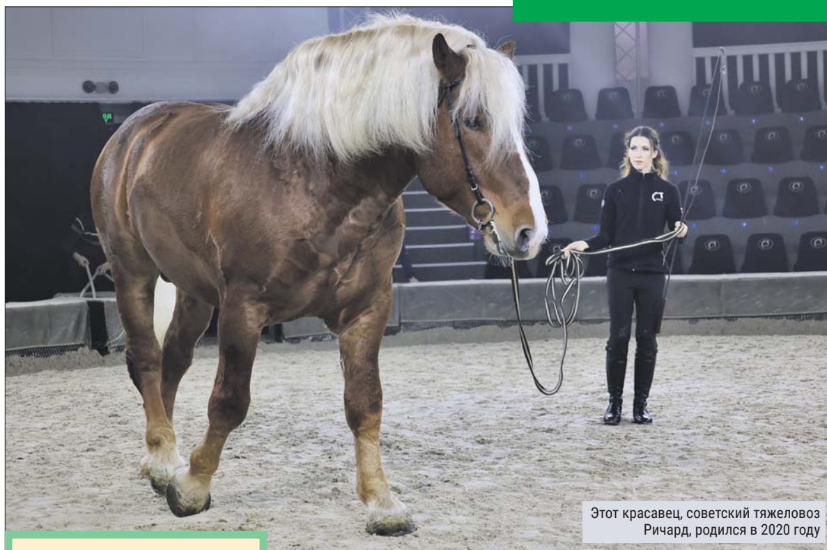
Этот красавец, советский тяжеловоз Ричард, родился в 2020 году

ЦНКТ открылся девять лет назад для того, чтобы знакомить посетителей с разными породами лошадей. Здесь можно увидеть орловскую рысистую, арабскую, русскую верховую, белорусскую упряжную, башкирскую, мезенскую... Есть и очень редкие. Например, вороно-чубарый