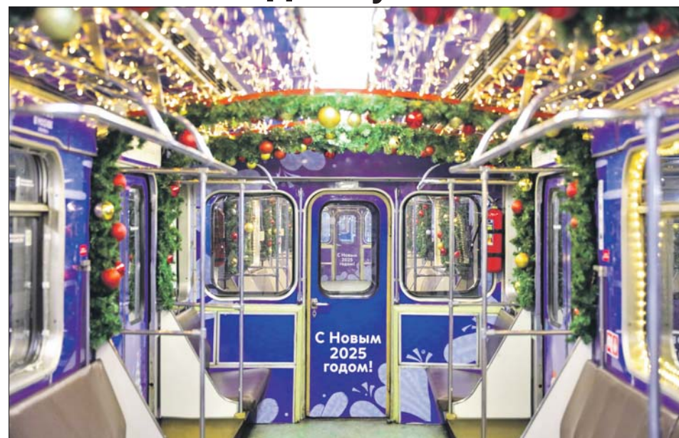
В СВАО такие составы возят пассажиров по серой, оранжевой и Большой кольцевой линиям