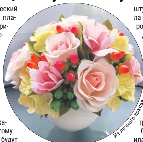
Особого изящества мастерица достигла в изготовлении роз