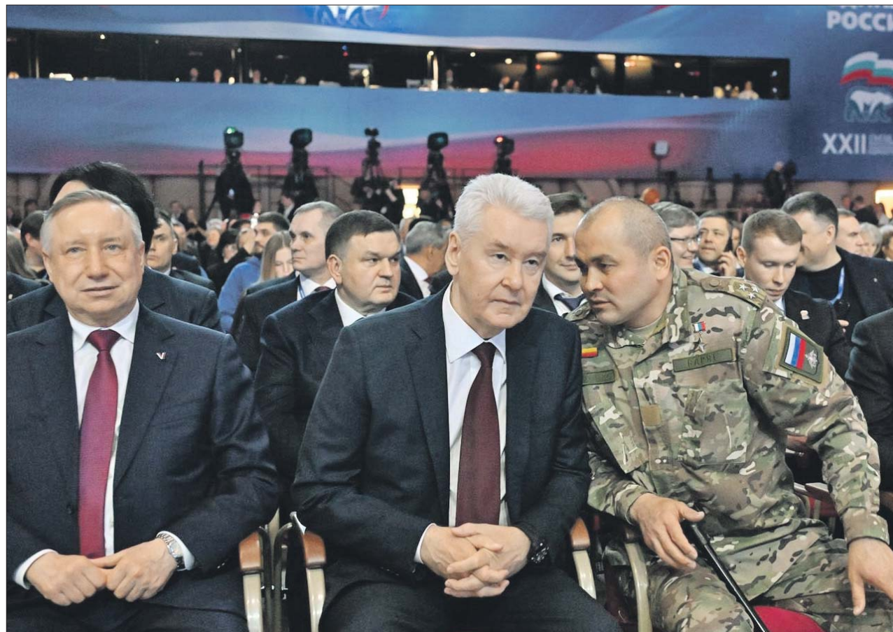
Сергей Собянин на съезде «Единой России»

Сергей Собянин подчеркнул, что Москва делает всё возможное для нашей победы. Вернувшимся с