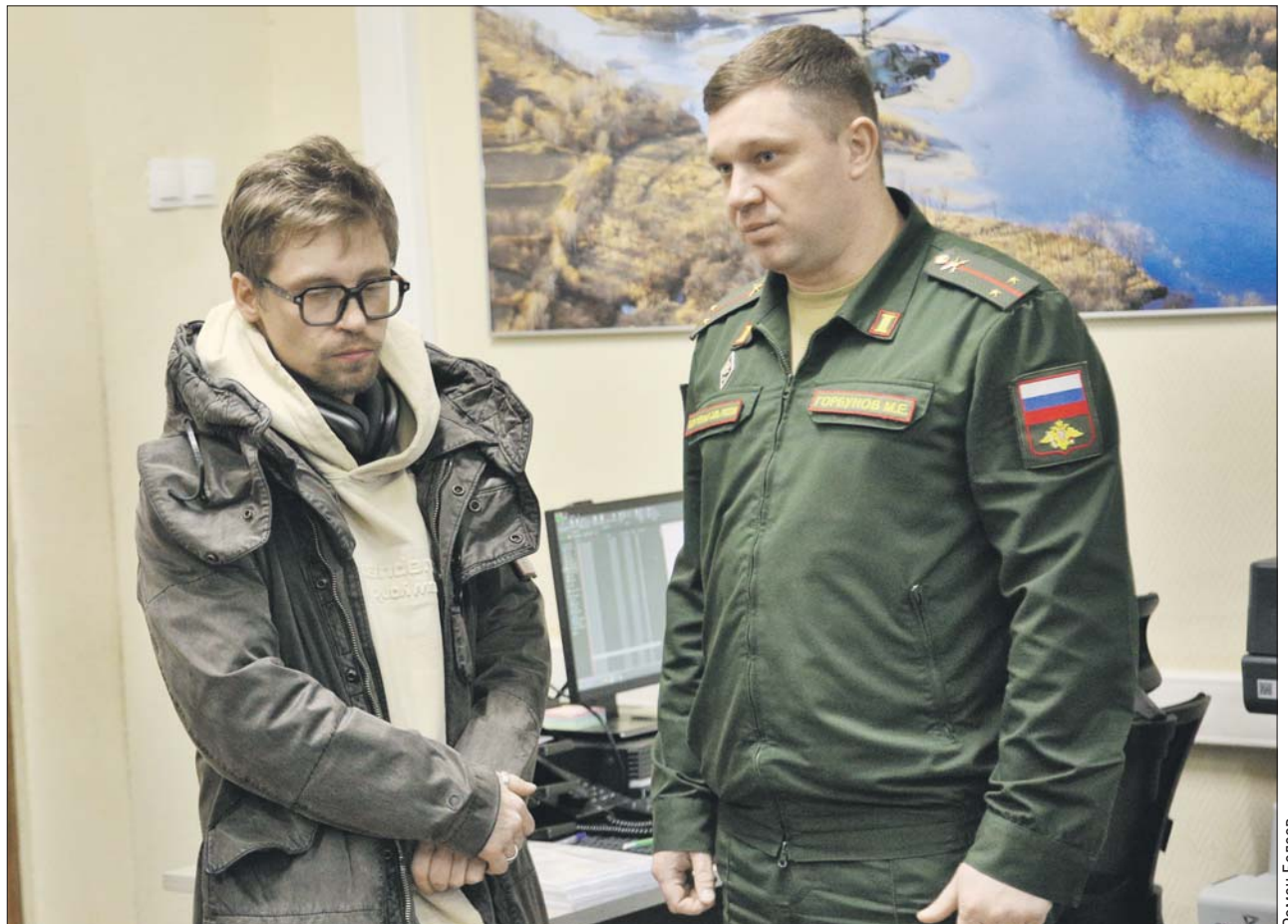
Актёр Александр Головин отметил, что в пункте можно пройти все этапы отбора и это очень удобно

— Я здесь не в первый раз. Всё очень уютно, прекрасно. В одном месте можно сразу пройти все процессы. Считаю, что это большой поступок для мужчины — принять решение защищать Родину. Это настоя-