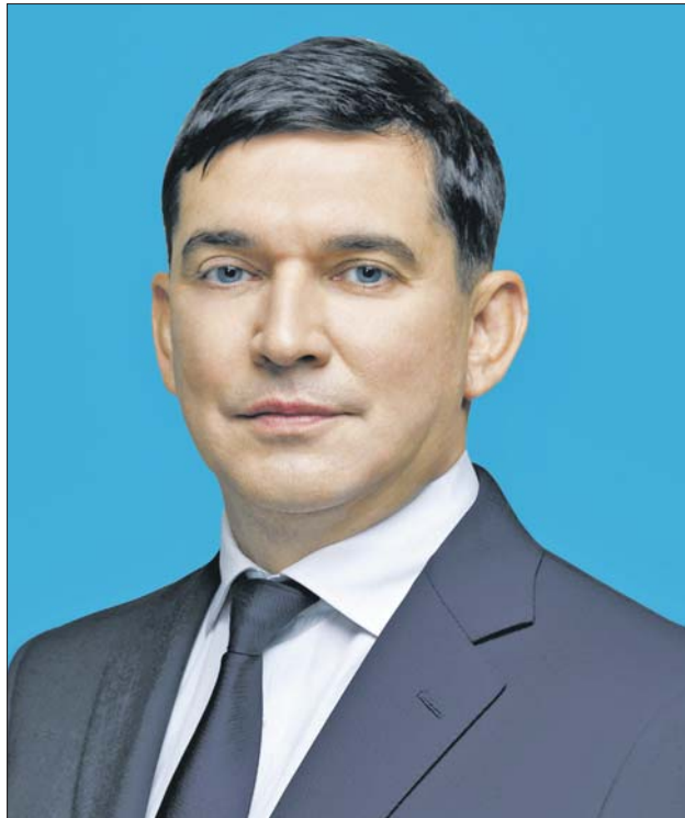
Префект Северо-Восточного административного округа г. Москвы Сергей Мельников

— Мы провели глубокое социальное исследование, собрали пожелания людей, выявили, сколько детей, молодых семей, людей старшего поколения здесь проживают. Рассчитали потребность в дополнительных парковочных местах: больше всего люди жаловались на хаотичную парковку. В результате в квартале создали две детские площадки: с горками, канатными мостиками и скалодромом для тех, кто старше, и с песочницами, каруселями, качелями для малышей. Ещё одна игровая площадка разместилась с внешней стороны 6-го корпуса. Позаботились о родителях: для них на всех площадках установили скамейки с навесами. Обустроили места тихого отдыха с парковыми качелями и садовыми диванами. Любители спорта получили