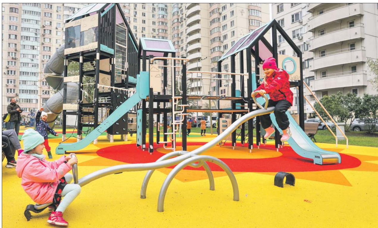
На Высоковольтном проезде обустроили игровые городки для детей разного возраста. Ноябрь 2024 года